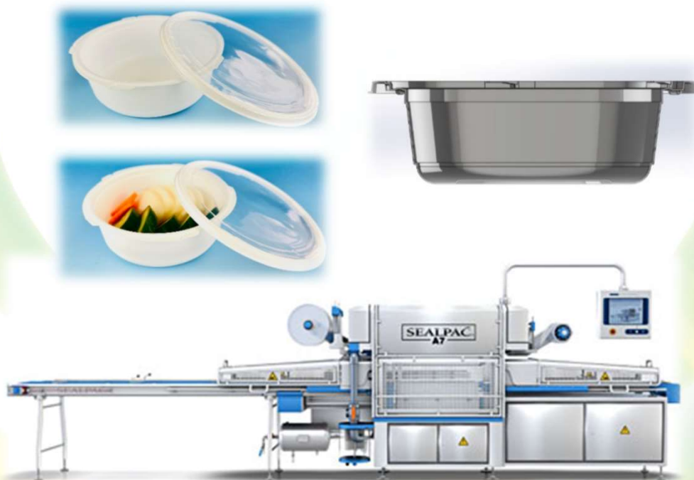
SEALPAC社のトレーシーラー Aシリーズ